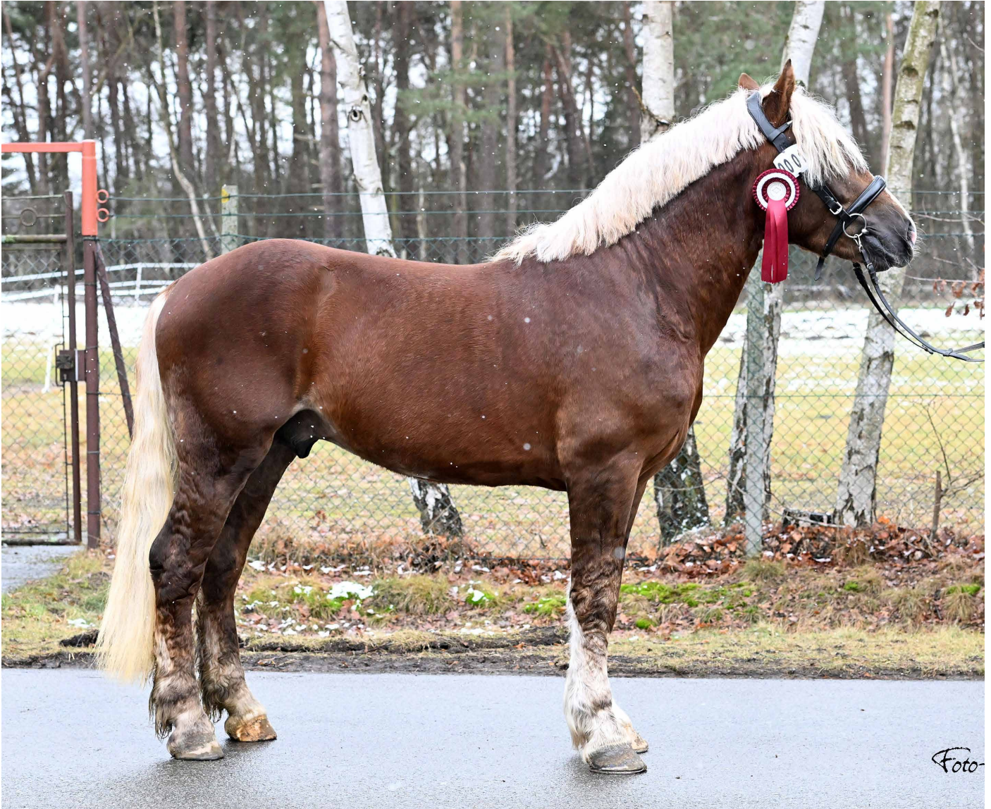
Weserbogen R

Am Samstag, den 14. Februar 2026, fand die Nachkörung des Stammbuchs für Kaltblutpferde Niedersachsen in Kooperation mit dem Ponyverband Hannover auf der Hengstprüfungsanstalt Adelheidsdorf statt.